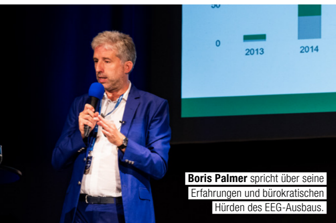
Boris Palmer spricht über seine Erfahrungen und bürokratischen Hürden des EEG-Ausbaus.