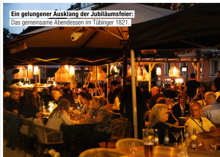
Ein gelungener Ausklang der Jubiläumsfeier: Das gemeinsame Abendessen im Tübinger 1821.