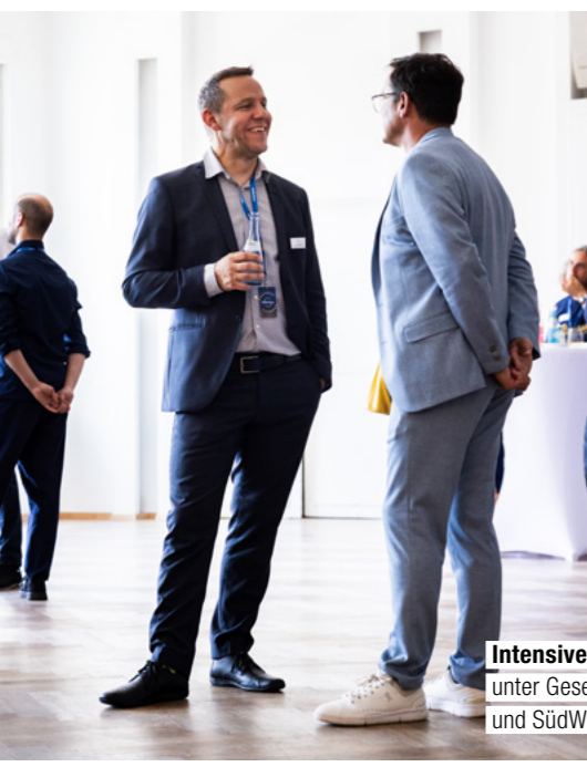
Intensiver Austausch unter Gesellschaftern und SüdWestStromern